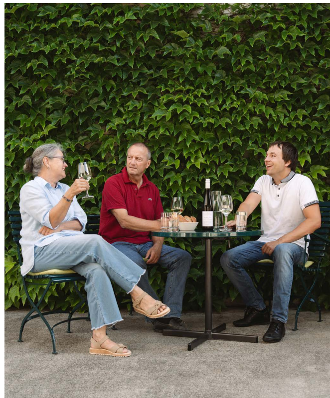
Der Pinot Noir ist und bleibt die Paradedisziplin im Weingut Baumann. Er kommt in nicht weniger als acht Varianten in die Flaschen, vom Federweissen über verschiedene rote Selektionen bis zur Trockenbeerenauslese.